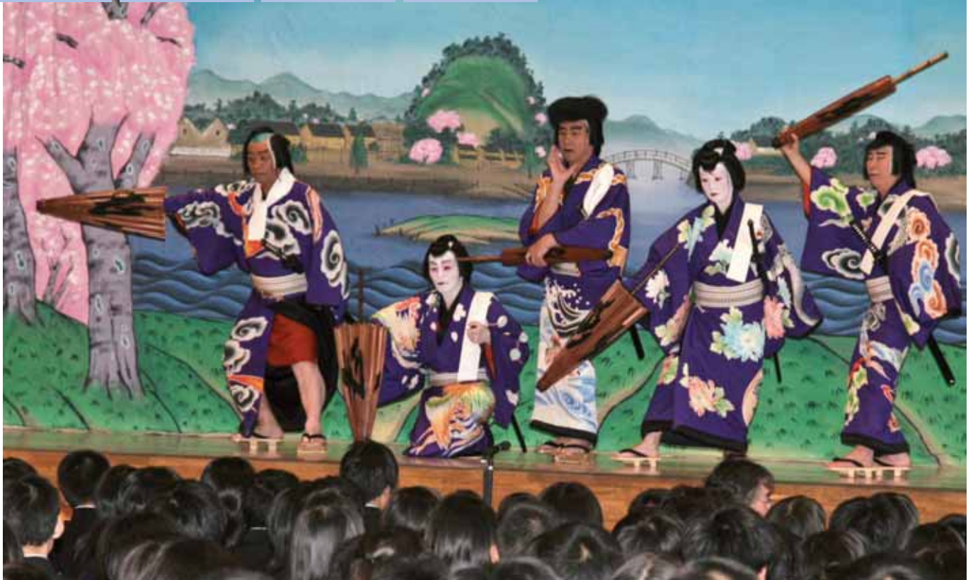
中学生に伝統文化の地歌舞伎を披露する新琴似歌舞伎伝承会の皆さん