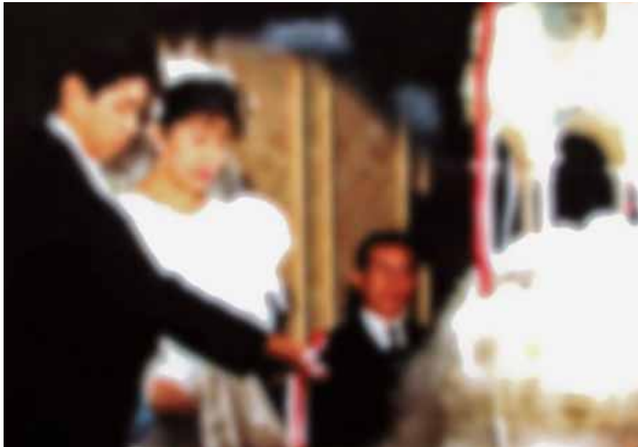
今日も幸せなカップルが...

ジューン・ブライド（6月の花嫁）の言葉どおりに、幸せそうなカップルで華やぐ市内の結婚式場。一方で結婚活動を意味する「婚活」という新たな言葉も生まれ、その一つとして「結婚相手紹介サービス」を利用する男女も大勢いますが、国民生活センターや市消費者センターには、契約内容や解約金などに関する苦情・相談が数多く寄せられています。最近の結婚事情を探ってみました。