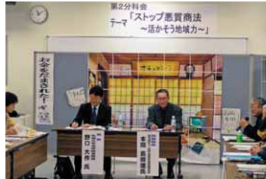
昨年開催した「さっぽろ消費者のつどい2008」での見守りネットワークづくりでの討議模様

消費生活みまもり協力員は、過去に消費者センターなどで相談員の経験のある人などに委嘱。各区